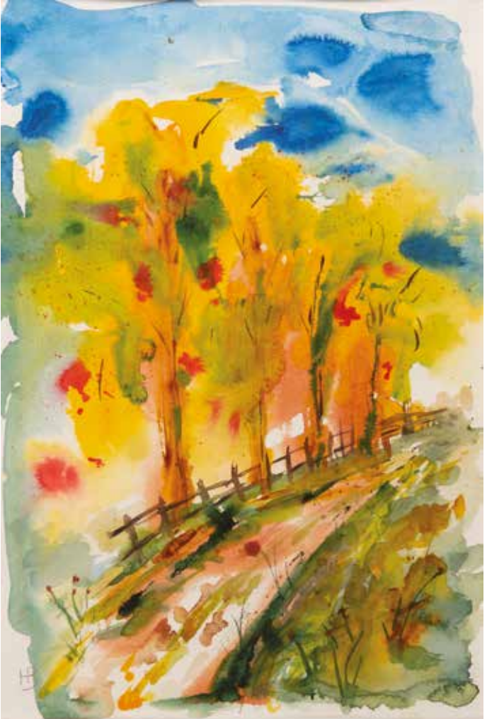
Helmut Baumgartl †